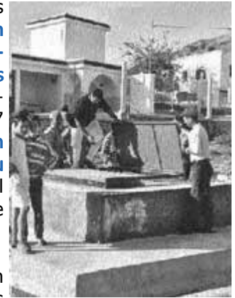
Château d'eau à Babt el Bir