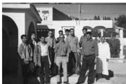
Visite du château d'eau avec l'association ALDOS