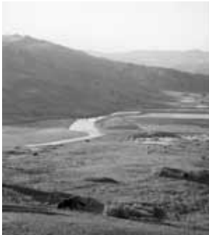
Région de Rhafsaï

Le Forum des ONG du Nord du Maroc (F.O.NORD)